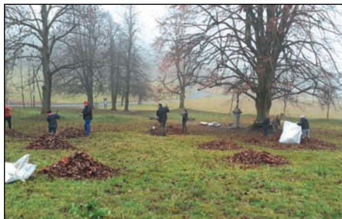
Úklid listí u křížku