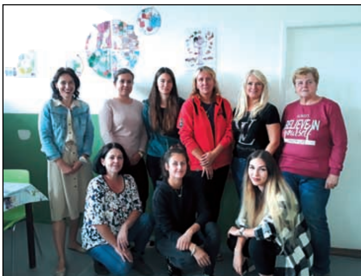
Tým který se staral o vaše děti na příměstském táboře 2021