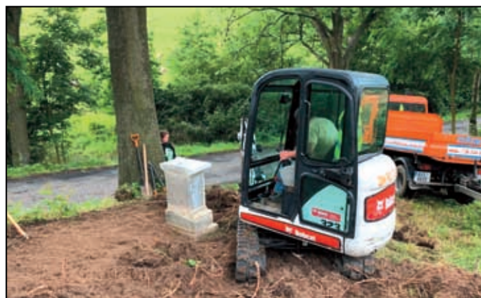
Obnova kříže Franze Merolda