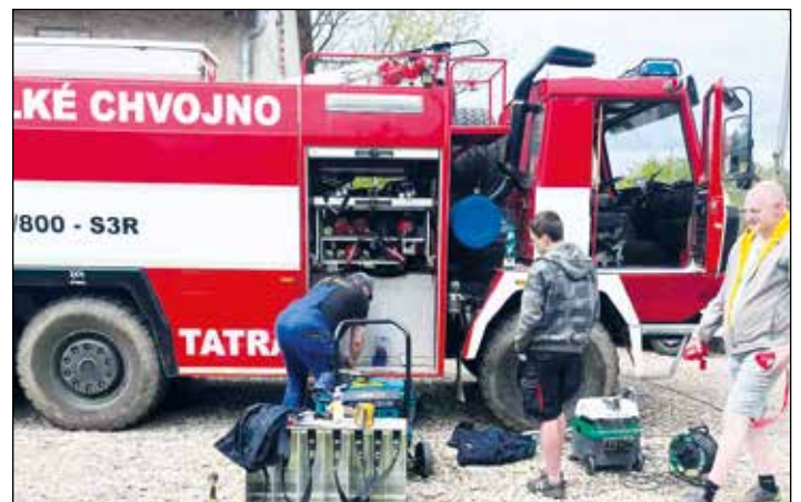
Údržba techniky po zásahu