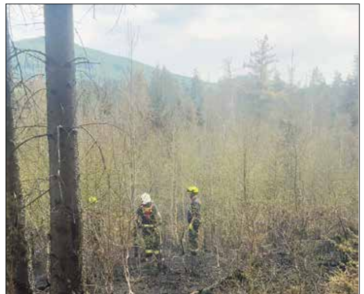
Květnový zásah při požáru v Českém Švýcarsku