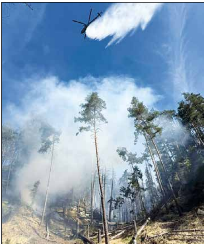
Požár v Českém Švýcarsku

V první řadě bychom rádi poděkovali našemu zřizovateli obci Velké Chvojno, jenž se snaží naší jednotku finančně podporovat. Jistě jste si všimli že díky finanční podpoře od nadace Agrofert nám byla na jaře zakoupena nová elektrocentrála od Heronu, která stála bez- (Pokračování na následující straně)